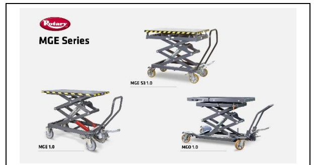
Mesas elevadoras - Serie Master Gear