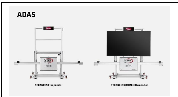
Alineadores de ruedas - ADAS