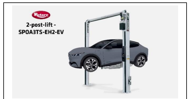
Elevador de 2 columnas – SPOA3TS-EH2-EV