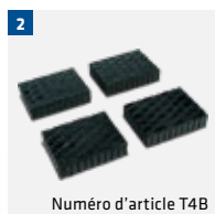
Numéro d'article T4B