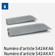
Numéro d'article S42AKA6 Numéro d'article S42AKA7