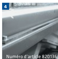
Numéro d'article 820136