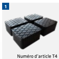
Numéro d'article T4