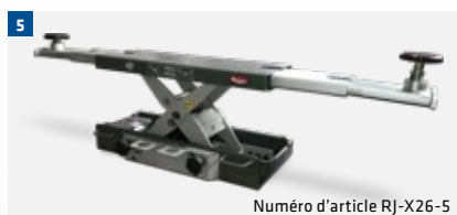
Numéro d'article RJ-X26-5